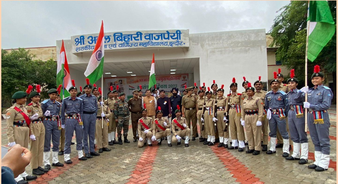
(कार्याक्रम की झलकियां)